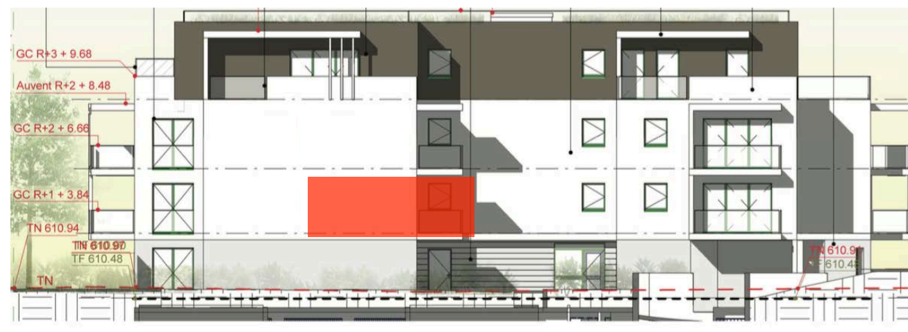
Elévation Nord Est