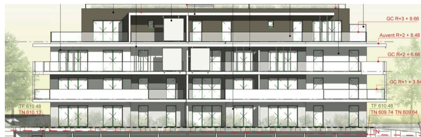
Elévation Sud Ouest

Nota : des modifications sont susceptibles d'être apportées à ce plan en fonction de nécessités techniques de la réalisation, tant en ce qui concerne les dimensions libres que l'équipement. Les canalisations, barbacanes, descentes EP, les retombées, faux plafonds, trappes de visite sur les gaines techniques, radiateurs ne sont pas figurés sur les plans. Les soffites ou caissons techniques ne sont pas tous représentés. Les surfaces indiquées sont approximatives. Les surfaces des jardins ne sont données qu'à titre indicatif. Les pentes ne sont pas représentées et seront adaptées en fonction du terrain naturel. Les surfaces sont approximatives et peuvent évoluer dans le cadre de la tolérance légale de 5%.