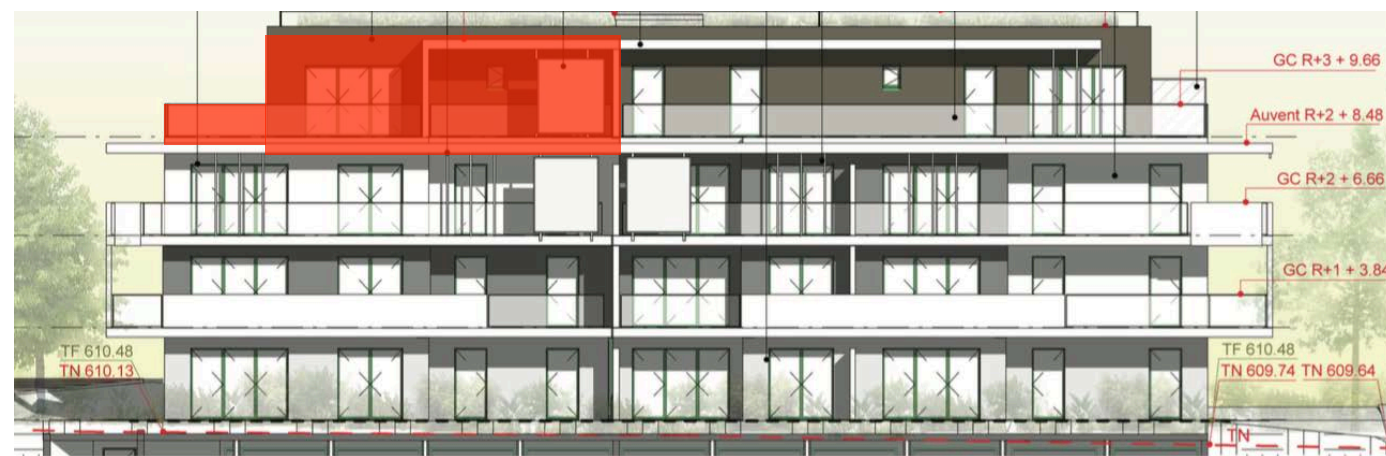
Elévation Sud Ouest

Nota : des modifications sont susceptibles d'être apportées à ce plan en fonction de nécessités techniques de la réalisation, tant en ce qui concerne les dimensions libres que l'équipement. Les canalisations, barbacanes, descentes EP, les retombées, faux plafonds, trappes de visite sur les gaines techniques, radiateurs ne sont pas figurés sur les plans. Les soffites ou caissons techniques ne sont pas tous représentés. Les surfaces indiquées sont approximatives. Les surfaces des jardins ne sont données qu'à titre indicatif. Les pentes ne sont pas représentées et seront adaptées en fonction du terrain naturel. Les surfaces sont approximatives et peuvent évoluer dans le cadre de la tolérance légale de 5%.