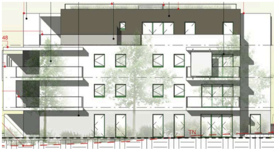
Elévation Sud Est