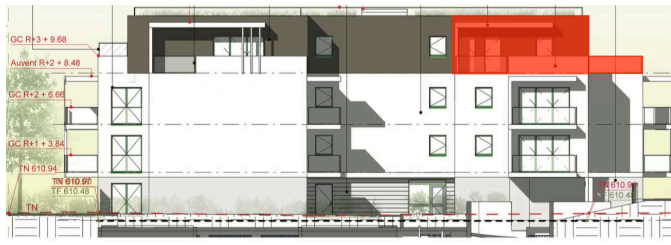
Elévation Nord Est