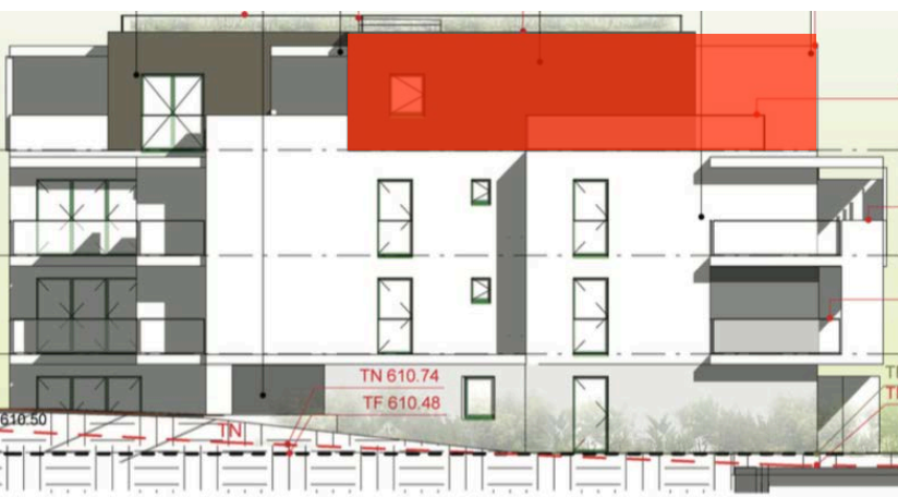
Elévation Nord Ouest