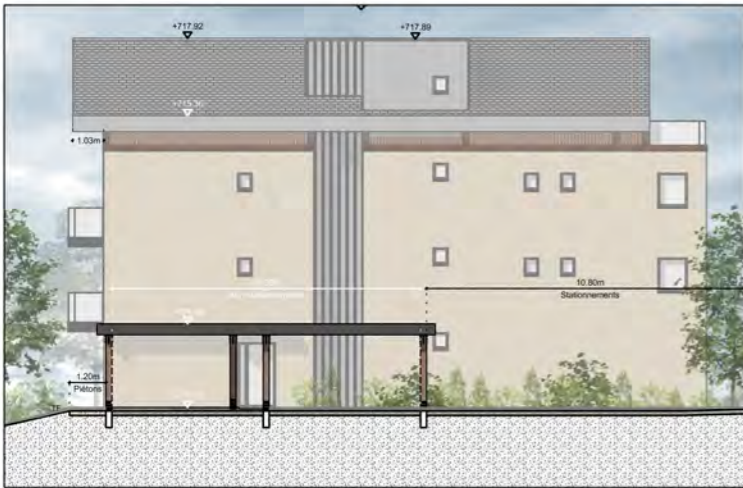
BÂTIMENT A - FAÇADE NORD