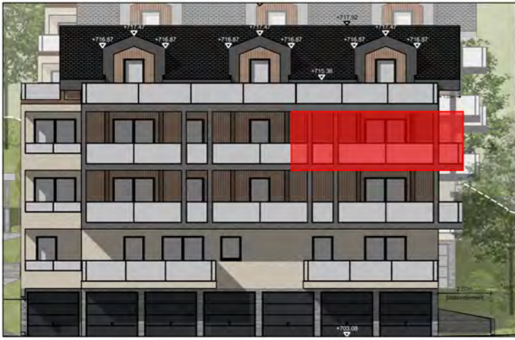
BÂTIMENT A - FAÇADE SUD