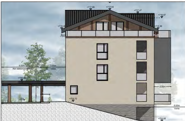
BÂTIMENT A - FAÇADE OUEST