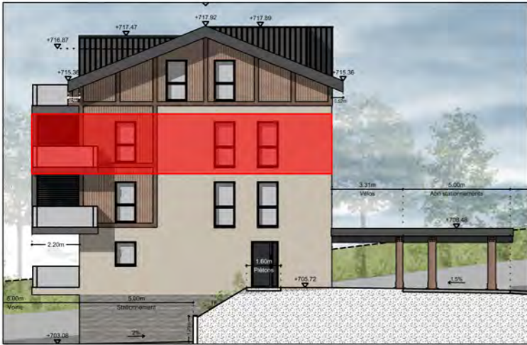
BÂTIMENT A - FAÇADE EST