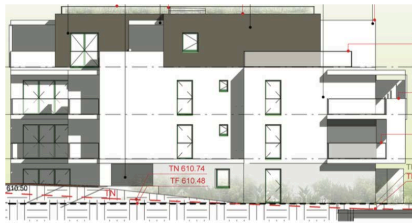
Elévation Nord Ouest