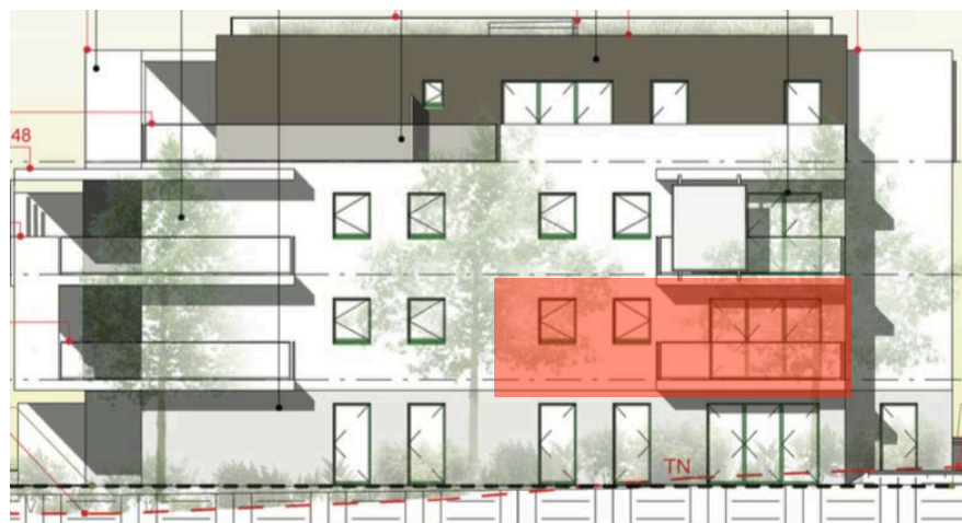
Elévation Sud Est