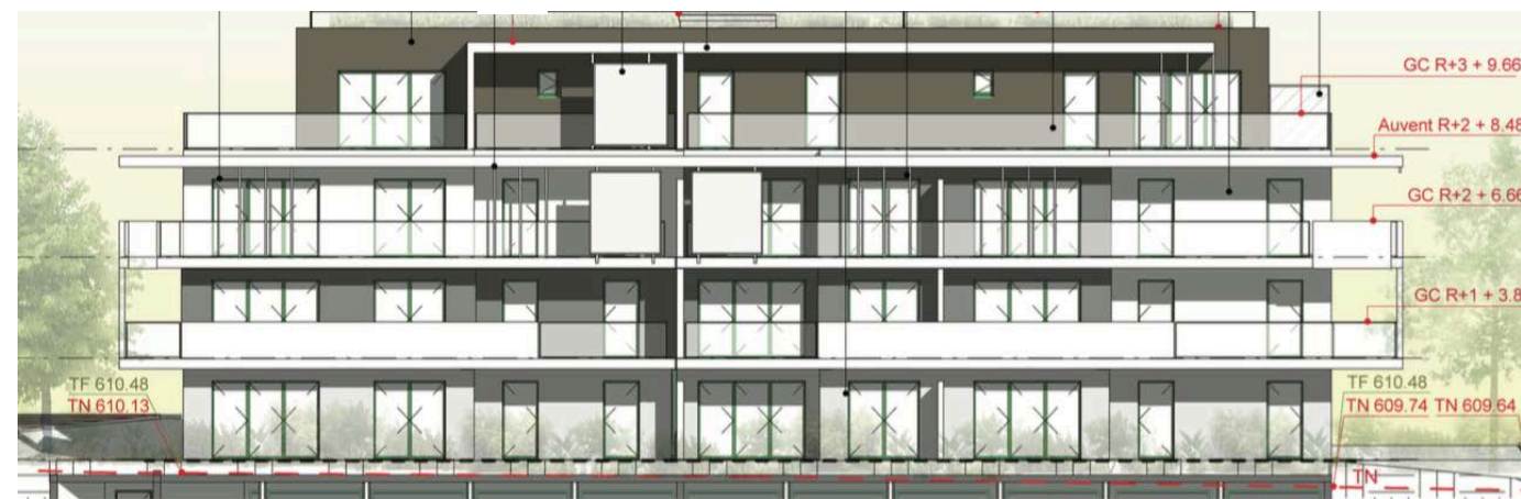
Elévation Sud Ouest

Nota : des modifications sont susceptibles d'être apportées à ce plan en fonction de nécessités techniques de la réalisation, tant en ce qui concerne les dimensions libres que l'équipement. Les canalisations, barbacanes, descentes EP, les retombées, faux plafonds, trappes de visite sur les gaines techniques, radiateurs ne sont pas figurés sur les plans. Les soffites ou caissons techniques ne sont pas tous représentés. Les surfaces indiquées sont approximatives. Les surfaces des jardins ne sont données qu'à titre indicatif. Les pentes ne sont pas représentées et seront adaptées en fonction du terrain naturel.