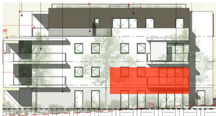
Elévation Sud Est