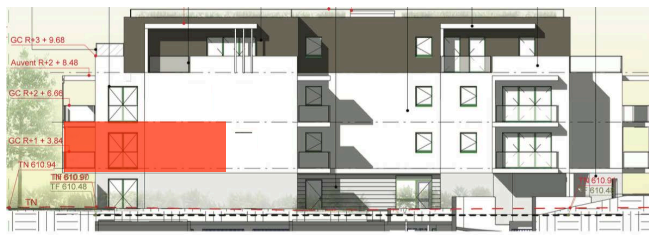
Elévation Nord Est