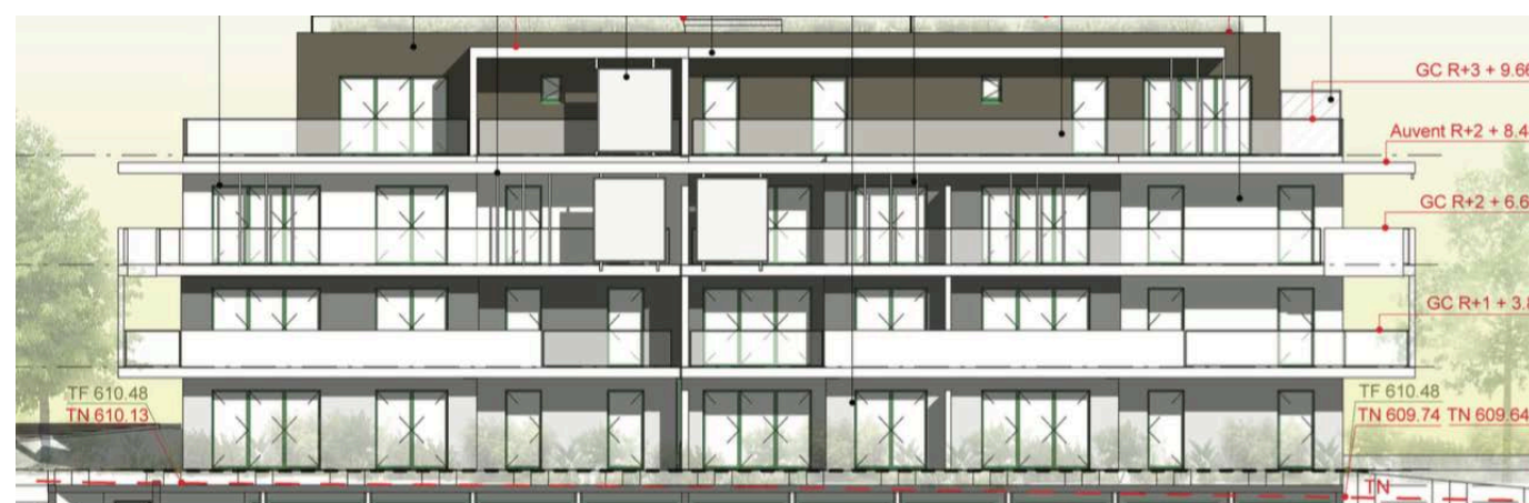
Elévation Sud Ouest