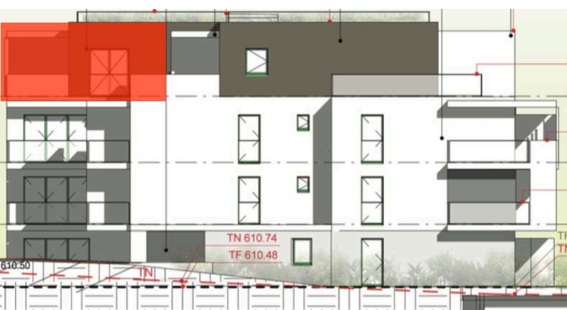
Elévation Nord Ouest