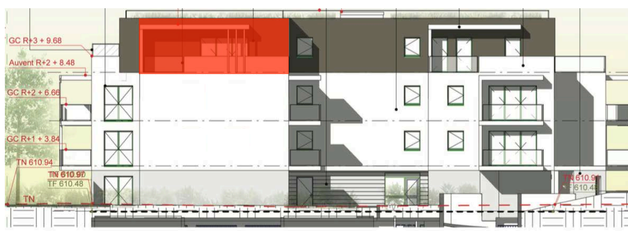
Elévation Nord Est