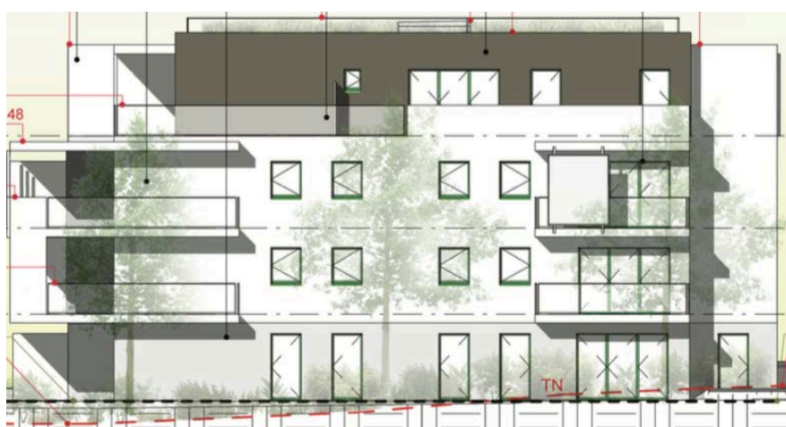
Elévation Sud Est