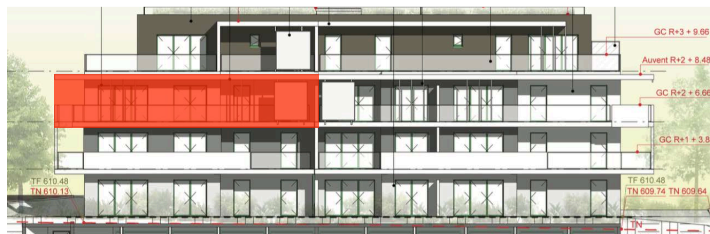
Elévation Sud Ouest