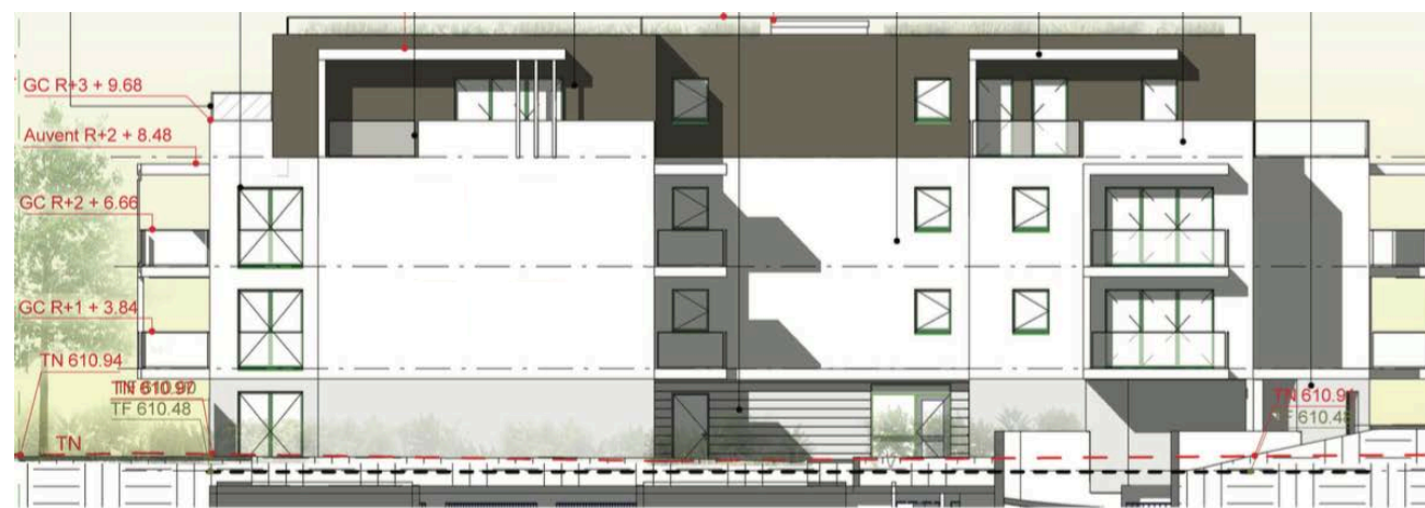
Elévation Nord Est