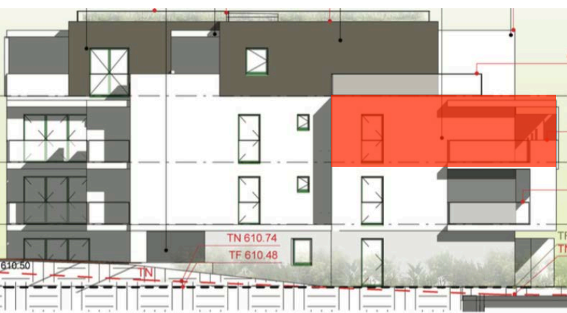
Elévation Nord Ouest