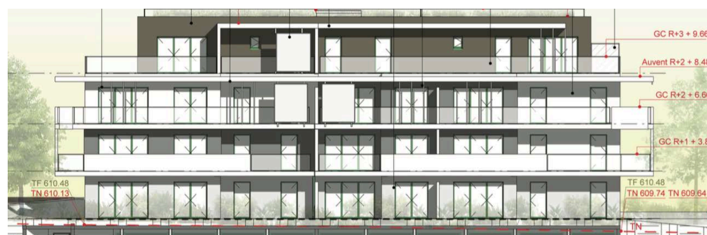
Elévation Sud Ouest

Nota : des modifications sont susceptibles d'être apportées à ce plan en fonction de nécessités techniques de la réalisation, tant en ce qui concerne les dimensions libres que l'équipement. Les canalisations, barbacanes, descentes EP, les retombées, faux plafonds, trappes de visite sur les gaines techniques, radiateurs ne sont pas figurés sur les plans. Les soffites ou caissons techniques ne sont pas tous représentés. Les surfaces indiquées sont approximatives. Les surfaces des jardins ne sont données qu'à titre indicatif. Les pentes ne sont pas représentées et seront adaptées en fonction du terrain naturel. Les surfaces sont approximatives et peuvent évoluer dans le cadre de la tolérance léqale de 5%.