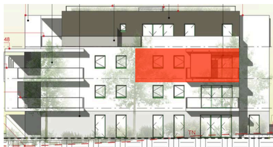
Elévation Sud Est