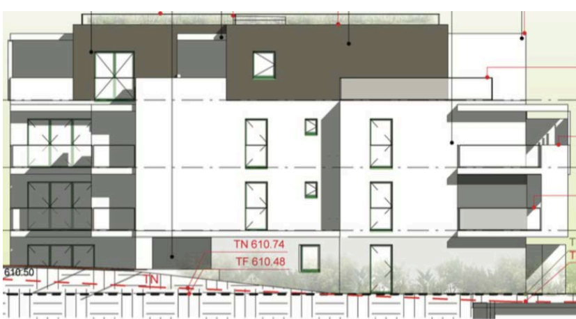
Elévation Nord Ouest