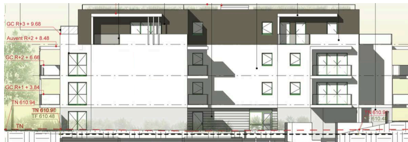
Elévation Nord Est