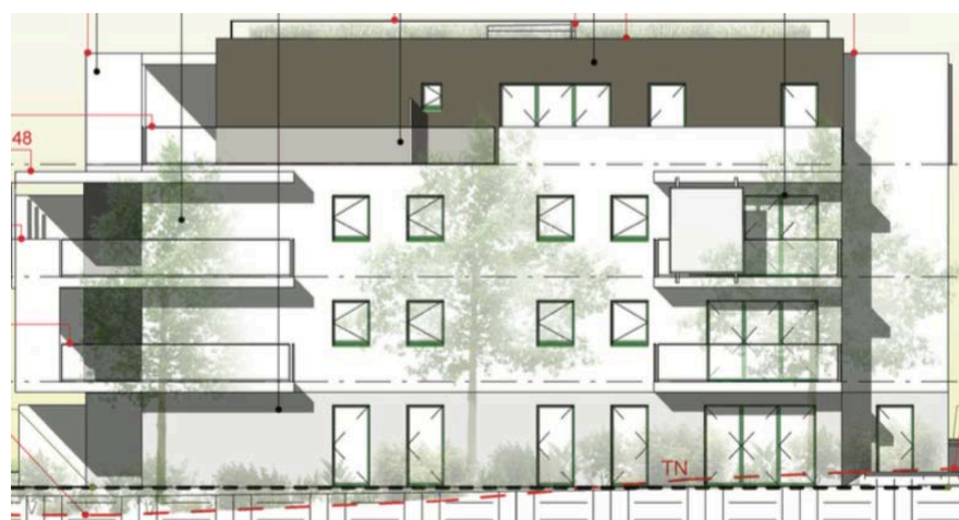
Elévation Sud Est