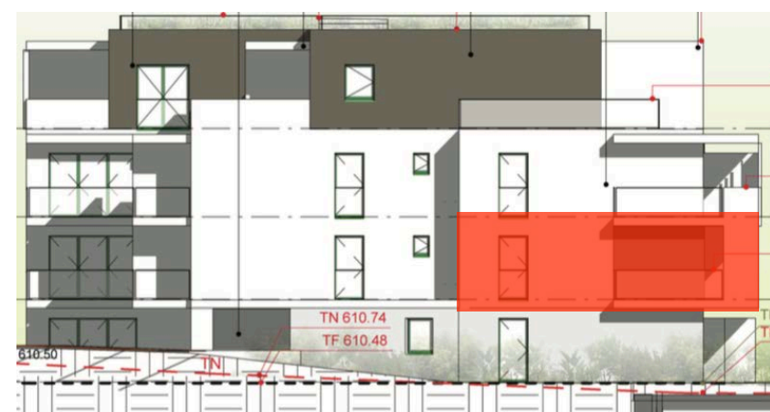
Elévation Nord Ouest