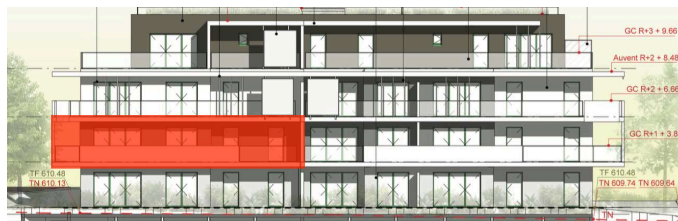
Elévation Sud Ouest

Nota : des modifications sont susceptibles d'être apportées à ce plan en fonction de nécessités techniques de la réalisation, tant en ce qui concerne les dimensions libres que l'équipement. Les canalisations, barbacanes, descentes EP, les retombées, faux plafonds, trappes de visite sur les gaines techniques, radiateurs ne sont pas figurés sur les plans. Les soffites ou caissons techniques ne sont pas tous représentés. Les surfaces indiquées sont approximatives. Les surfaces des jardins ne sont données qu'à titre indicatif. Les pentes ne sont pas représentées et seront adaptées en fonction du terrain naturel. Les surfaces sont approximatives et peuvent évoluer dans le cadre de la tolérance légale de 5%.