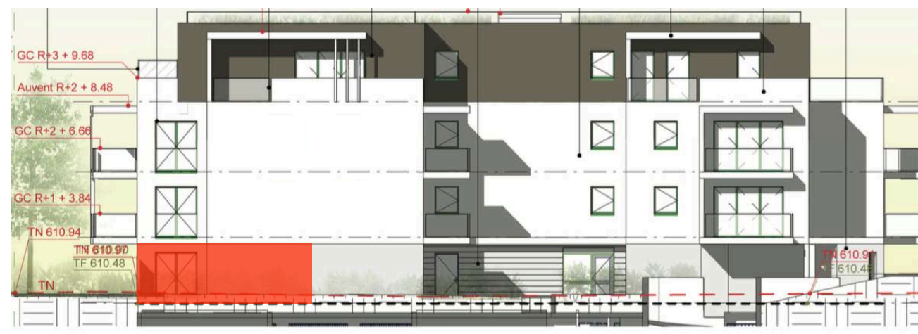
Elévation Nord Est