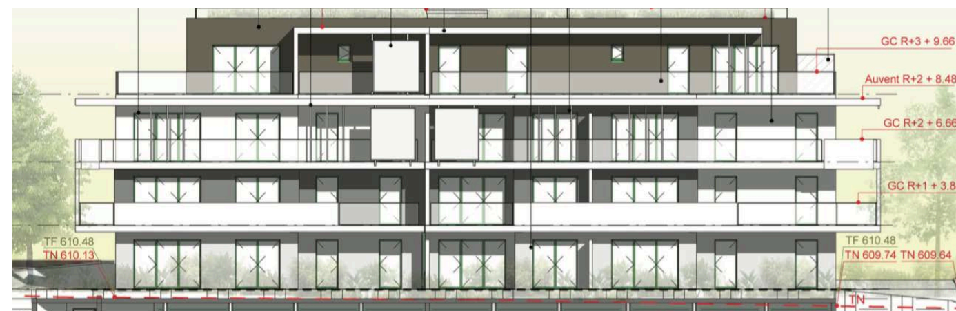
Elévation Sud Ouest

Nota : des modifications sont susceptibles d'être apportées à ce plan en fonction de nécessités techniques de la réalisation, tant en ce qui concerne les dimensions libres que l'équipement. Les canalisations, barbacanes, descentes EP, les retombées, faux plafonds, trappes de visite sur les gaines techniques, radiateurs ne sont pas figurés sur les plans. Les soffites ou caissons techniques ne sont pas tous représentés. Les surfaces indiquées sont approximatives. Les surfaces des jardins ne sont données qu'à titre indicatif. Les pentes ne sont pas représentées et seront adaptées en fonction du terrain naturel. Les surfaces sont approximatives et peuvent évoluer dans le cadre de la tolérance léqale de 5%.