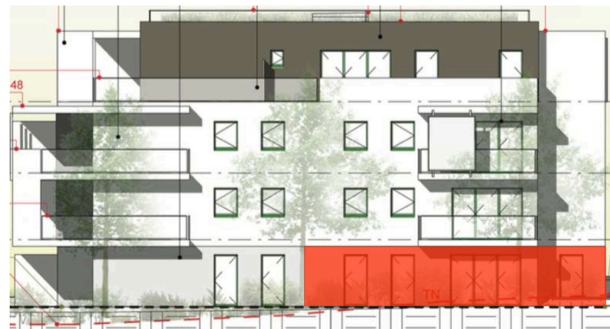
Elévation Sud Est