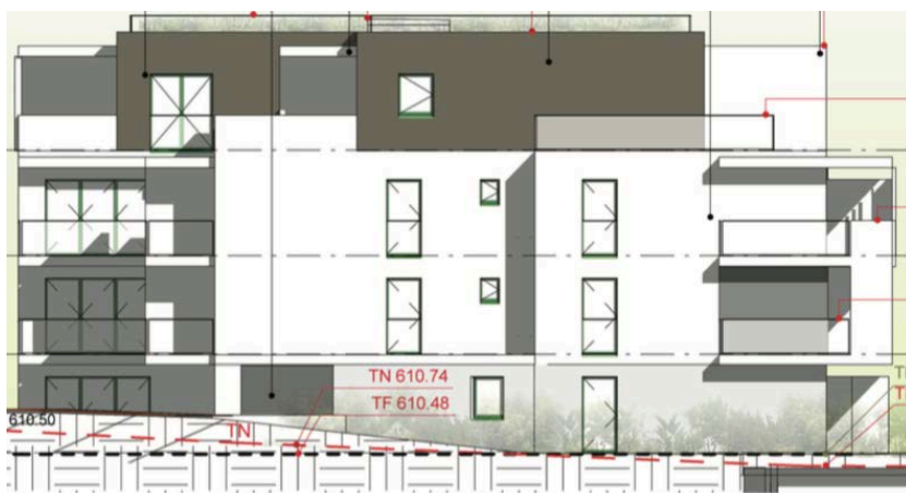
Elévation Nord Ouest