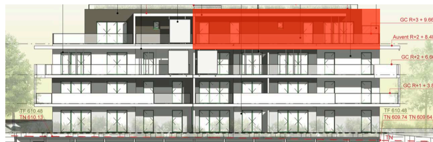
Elévation Sud Ouest

Nota : des modifications sont susceptibles d'être apportées à ce plan en fonction de nécessités techniques de la réalisation, tant en ce qui concerne les dimensions libres que l'équipement. Les canalisations, barbacanes, descentes EP, les retombées, faux plafonds, trappes de visite sur les gaines techniques, radiateurs ne sont pas figurés sur les plans. Les soffites ou caissons techniques ne sont pas tous représentés. Les surfaces indiquées sont approximatives. Les surfaces des jardins ne sont données qu'à titre indicatif. Les pentes ne sont pas représentées et seront adaptées en fonction du terrain naturel. Les surfaces sont approximatives et peuvent évoluer dans le cadre de la tolérance légale de 5%.