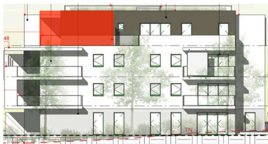
Elévation Sud Est