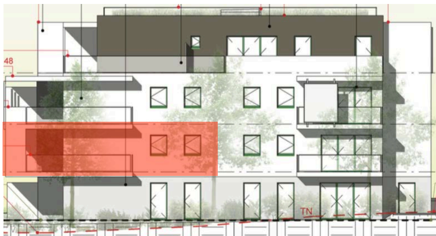
Elévation Sud Est