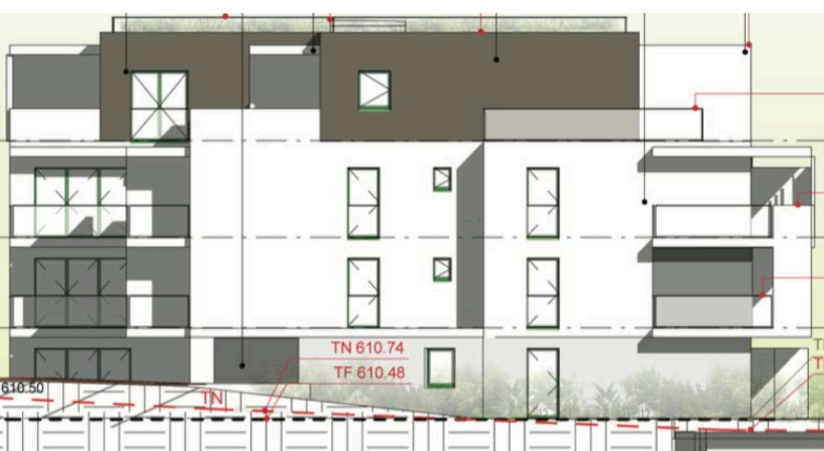
Elévation Nord Ouest