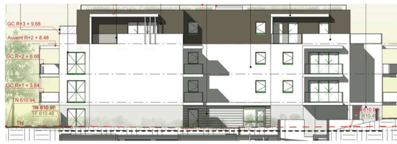
Elévation Nord Est