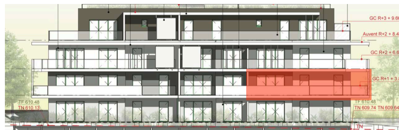
Elévation Sud Ouest