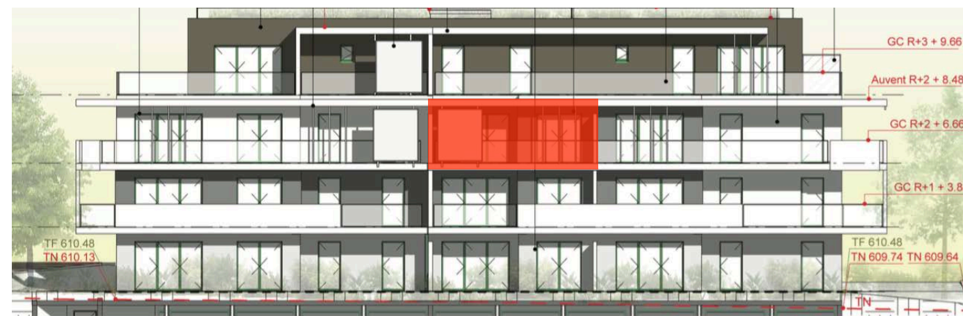
Elévation Sud Ouest

Nota : des modifications sont susceptibles d'être apportées à ce plan en fonction de nécessités techniques de la réalisation, tant en ce qui concerne les dimensions libres que l'équipement. Les canalisations, barbacanes, descentes EP, les retombées, faux plafonds, trappes de visite sur les gaines techniques, radiateurs ne sont pas figurés sur les plans. Les soffites ou caissons techniques ne sont pas tous représentés. Les surfaces indiquées sont approximatives. Les surfaces des jardins ne sont données qu'à titre indicatif. Les pentes ne sont pas représentées et seront adaptées en fonction du terrain naturel. Les surfaces sont approximatives et peuvent évoluer dans le cadre de la tolérance légale de 5%.