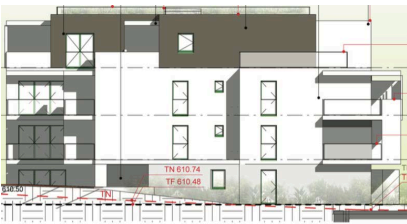
Elévation Nord Ouest