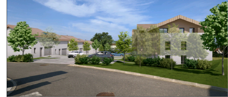
"LA COMBE" - 74350 VILLY-LE-PELLOUX