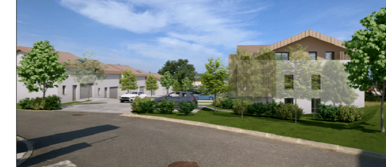
"LA COMBE" - 74350 VILLY-LE-PELLOUX