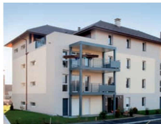
Jardins République, Bâtiment D.

L'éco-quartier labellisé “Minergie®” est venu s'inscrire naturellement dans notre paysage épagnien, en amont des prises de position liées au développement durable . Participant aux changements de la société, ils renforcent aussi la centralité de notre commune autour de l'édifice principal abritant les services municipaux.”