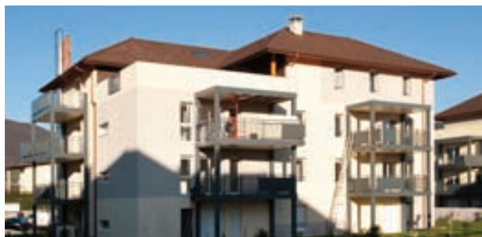
Jardins République, Bâtiment D.